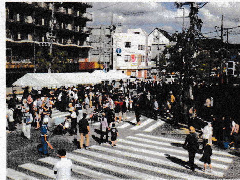
参加者で賑わう様子

また、令和6年12月2日をもって、中橋は全面通行止めとなりました。今後、歩行者と自転車は下流に設けられた仮設通路を通行することになります。（車の通行はできません。田中橋や渡良瀬橋などへの迂回をお願いします。）