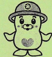
足利市社協マスコット あしのすけ